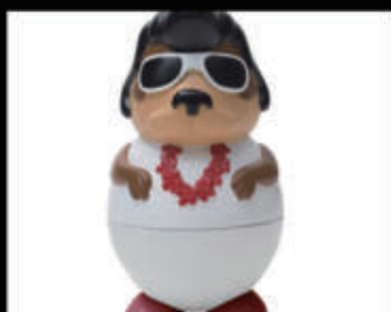
Elvis (gelato al cioccolato) € 5,00