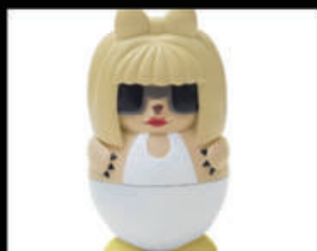
Lady (gelato alla fragola) € 5,00