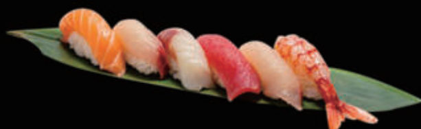
30. Nigiri misto 6pz € 8,00