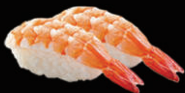
24. Nigiri di gambero cotto* € 3,00