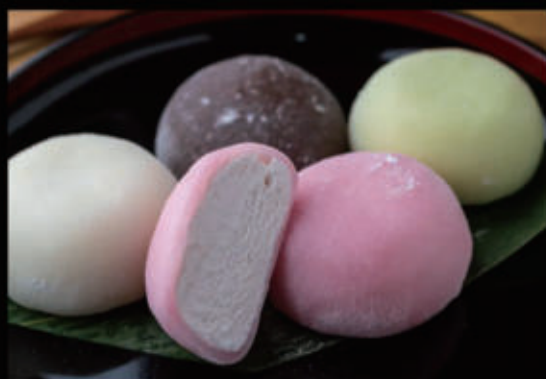
Mochi gelato (fragole, tè verde, mango, cocco, vaniglia, frutto della passione, cioccolato) € 5,00