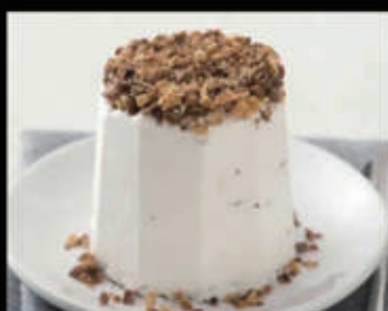
Semifreddo alle mandorle € 6,00