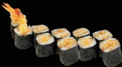
114. Hosomaki gambero* fritto € 5,00