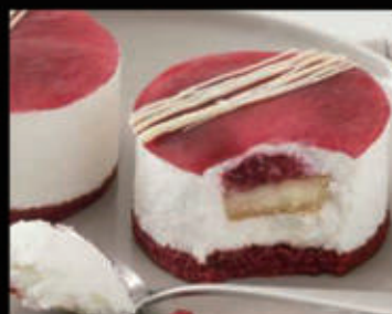
Cremoso ai frutti rossi € 6,00