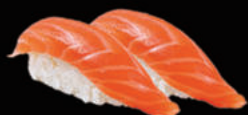
21. Nigiri di salmone € 3,00