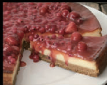
Cheesecake fragole € 6,00