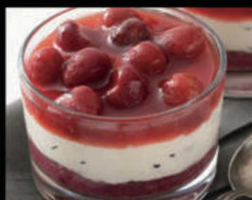
Mascarpone e fragole € 6,00