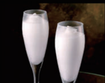
Sorbetto al limone € 4,00