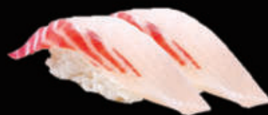
23. Nigiri di branzino € 3,00