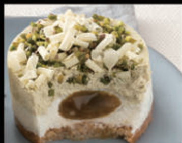
Cremoso al pistacchio € 6,00