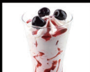
Coppa spagnola € 5,00