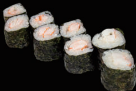
115. Hosomaki gambero* cotto € 5,00