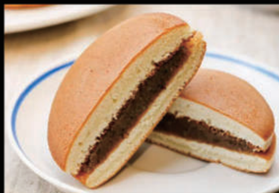
Dorayaki (fagioli di soia) € 4,50