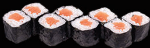
112. Hosomaki salmone € 5,00