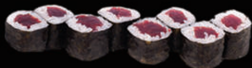
113. Hosomaki tonno € 6,00