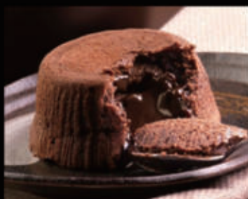
Soufflè al cioccolato € 5,00