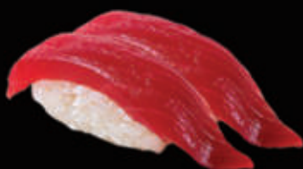
22. Nigiri di tonno € 3,50