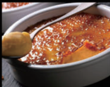
Crema catalana in coccia € 6,00