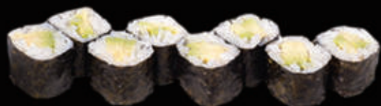
111. Hosomaki avocado € 4,00