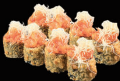
116. Hosomaki fritto con salmone € 6,00