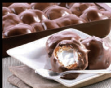
Profiterol scuro € 5,00