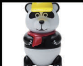
Pan Dan (gelato alla vaniglia) € 5,00