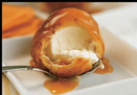
Gelato fritto (gusto crema) € 4,50